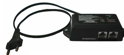
AC-DC PSM20 RJ-45