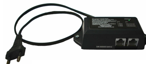
AC-DC PSM20 RJ-45